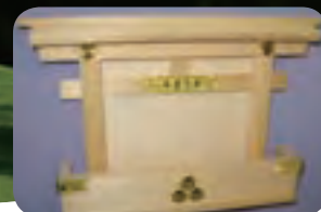
登録意匠第1165958号「宝くじ受」