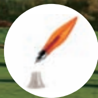
登録意匠第1287501号「ボールペン」